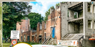
Bunkercomplex Park Overvoorde Rijswijk