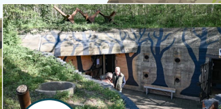
Atlantikwall Museum Scheveningen