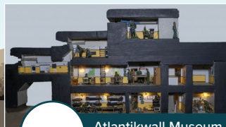
Atlantikwall Museum Noordwijk