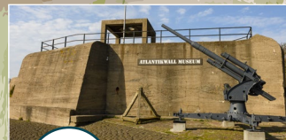
Atlantikwall-Museum Hoek van Holland