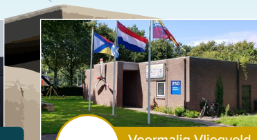
Voormalig Vliegveld Valkenburg