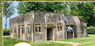
Spiel- en Bunkerpark Groede