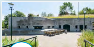
Fort aan de Drecht