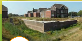
Fort Sint Michiel